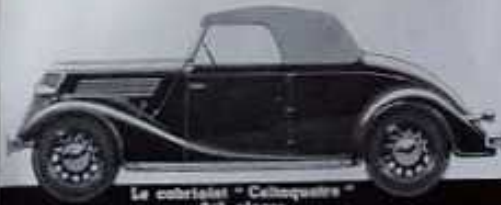
Le cabriolet "Celtaquatre" 2/3 places