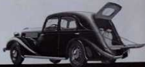
La conduite intérieure commerciale

LA NOUVELLE "CELTAQUATRE" 157 LIVRÉE AVEC LES CARROSSERIES SUIVANTES :