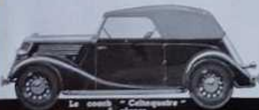
Le coupé "Celtaquatre" 5 places

DANS LA "CELTAQUATRE" TOUT A ÉTÉ CONÇU EN VUE DU RENDEMENT DE LA VOITURE, DE L'AGRÈMENT DES PASSAGERS ET DU FAIBLE CÔÛT D'EXPLOITATION.