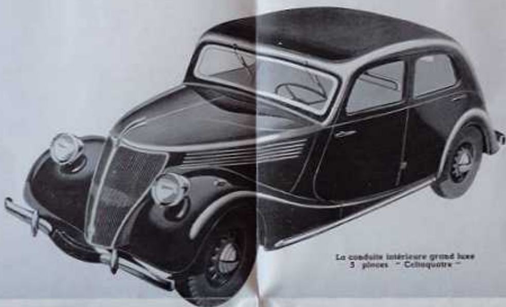
La conduite intérieure grand luxe 5 places "Celtaquatre"

La largeur intérieure de la CELTAQUATRE atteint 1 m. 21. L'attention de la totalité de la largeur de la carrosserie réserve 3 places sur le siège arrière et 2 places plates sur le siège avant. Le nouveau dispositif en 2 points, complété par 4 amortisseurs hydrauliques puissants, assure un confort incomparable et une tenue de route magnifique. Les passagers sont à l'abri du vent et de la poussière dans un cadre intérieur de grande dimension, au-dessus d'une motte à double axes.