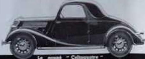
Le coupé "Celtaquatre" 2/3 places